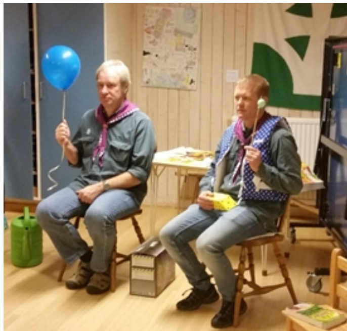
Ibland hittar man guldkorn när man letar igenom gamla bilder

På min sista tonårssamling så fick jag frågan om vad det konstigaste jag har upplevt på tonår och det finns många saker under kategorin konstigt eller kanske kategorin "ehh...vad är det som händer nu".