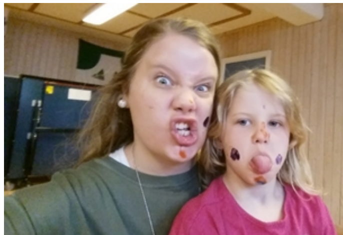
Söndagsskola och ibland roligare att kladda på varandra än att göra det pysslet som jag planerat

Antal ungdomar som under någon period regelbundet hängt på tonår: 43 st