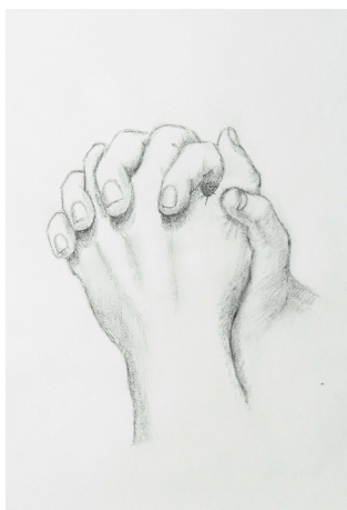
Skiss av Christina Elg